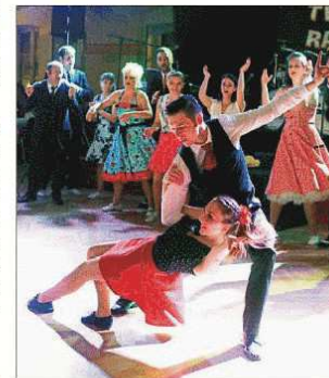
Heiße Sohle: die Boogie-Woogie-Gruppe Pink Panther des ETSV 09