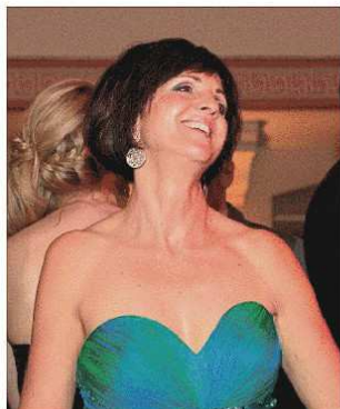
Bestens unterhalten fühlte sich offensichtlich auch diese Dame.