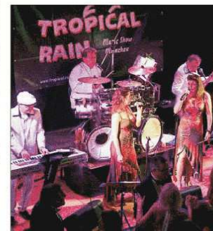
Die Band „Tropical Rain“ aus München gab unumstritten den Takt vor.