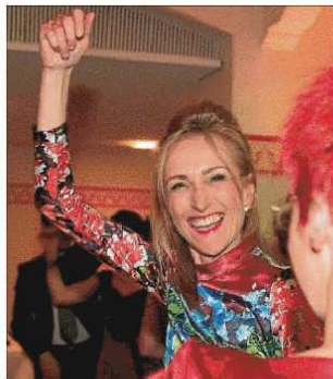
Ausgelassen war die Stimmung beim Lions Ball nicht nur bei dieser Dame.