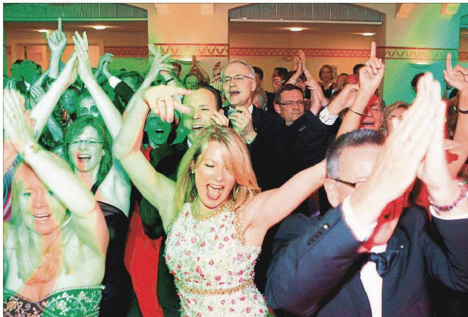
Nahezu ekstatisch tanzte so mancher durch die Ballnacht.