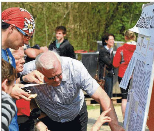
Wer liegt wo? Bei „Landshut läuft“ war die LZ der Informationslieferant Nummer eins. Am Stand gab es die Ergebnisse des Zeitmessers.